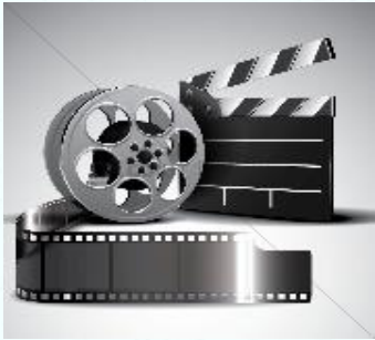
فيلم و دراما