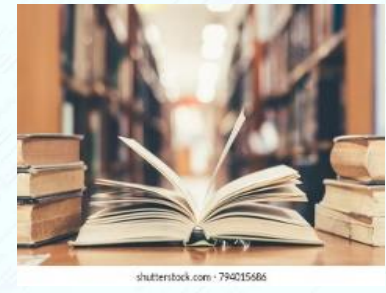
النشر الاعمال الأدبية